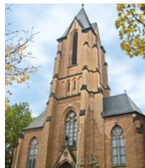
St. Mariä Himmelfahrt (Liebfrauen)