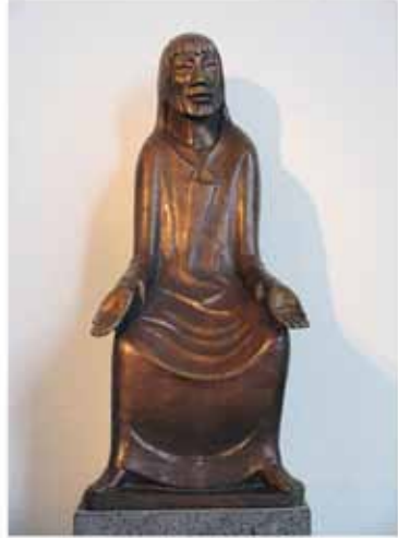
Ernst Barlach, Der lehrende Christus, Antoniterkirche Köln

Jesus ist nicht nur ein Freund. Er ist auch Lehrer der Wahrheit und des Lebens. Er zeigt uns den Weg, wie wir glücklich werden können.