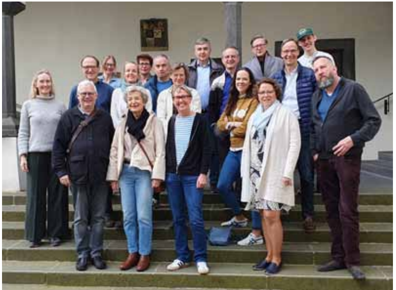
Der Pfarrgemeinderat Flingern/Düsseltal zur Klausurtagung in Siegburg.